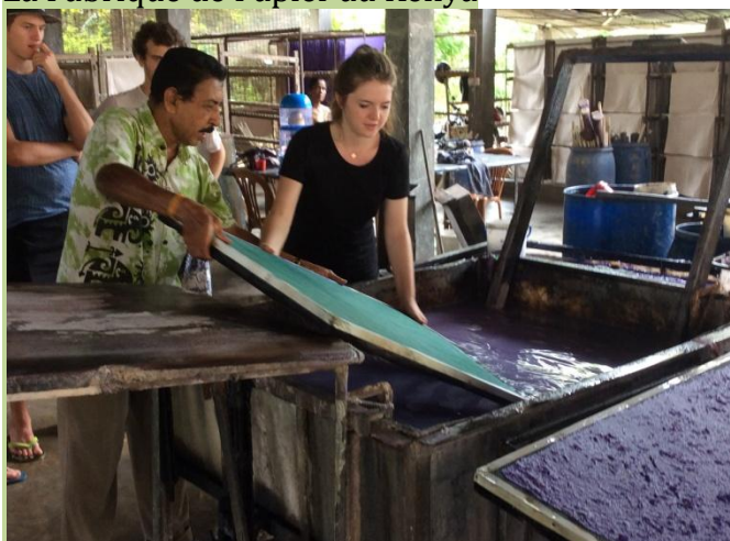
La Fabrique de Papier au Kenya

La fabrique de papier recyclé en bouse d'éléphant, exemple d'un projet de commerce équitable et d'activités génératrice de revenus, permet de faire vivre en harmonie les hommes et les éléphants. Nous avons modélisé le concept au Sri Lanka. Acheter ce papier, en vente à « Artisan du Monde » Nice et sur notre site internet, permet de freiner la déforestation et le braconnage tout en améliorant les conditions de vies des autochtones.