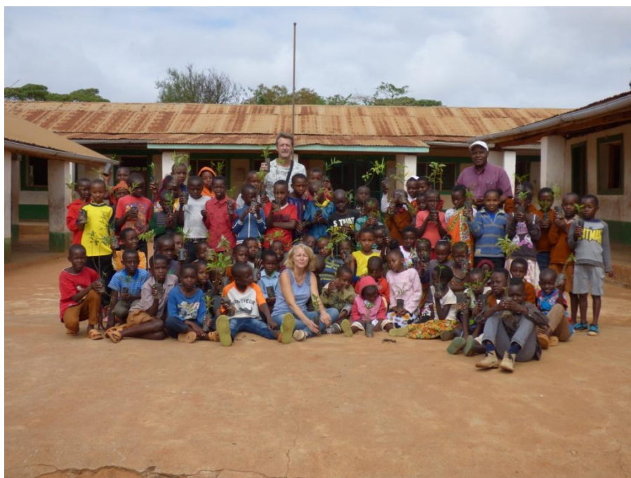
Mission 2017, plantation du Jardin potager à Maktau School Kenya

Delphine Thibaut pour l'équipe « Sens Solidaires »