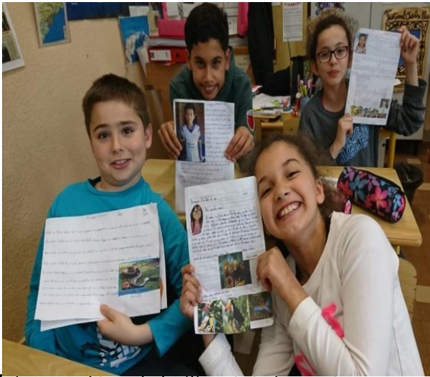
Echanges scolaires entre les élèves niçois et amazoniens

Nous répondons à la demande grandissante des établissements scolaires concernant l'éducation au développement durable. Les équipes enseignantes sont motivées par cet apprentissage mais n'ont pas souvent le temps de le mettre en place. Notre collaboration est un appui précieux. Toutes nos interventions pédagogiques sont accompagnées d'exemples concrets de projets d'aide au développement que nous menons sur le terrain avec l'aide de nos volontaires à l'international.