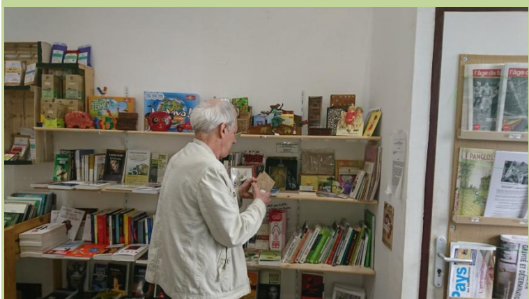
Artisan du Monde, 5 rue Vernier à Nice