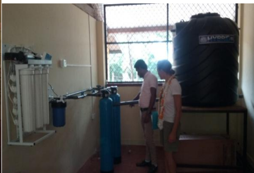
Education environnementale dans les écoles en lien avec les correspondances françaises. Installation de filtres osmose inversés pour le traitement de l'eau à l'école de Psudiulwewa, région d'Habarana.