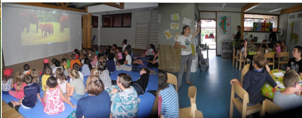
La Maison de l'Environnement, Le Parc Phoenix et les Foyers ruraux Grand Canton de Genève