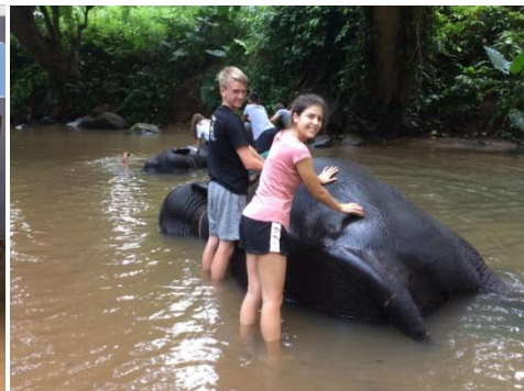
Projet de construction de la salle informatique à l'école de Weragala. A la Fondation : soins quotidiens des éléphants domestiques maltraités : bain, repas et nettoyage des litières.