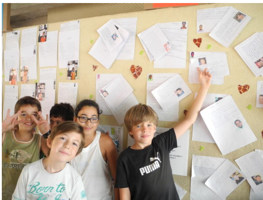
Echange scolaire entre les élèves kényans et niçois sur les défis environnementaux de demain