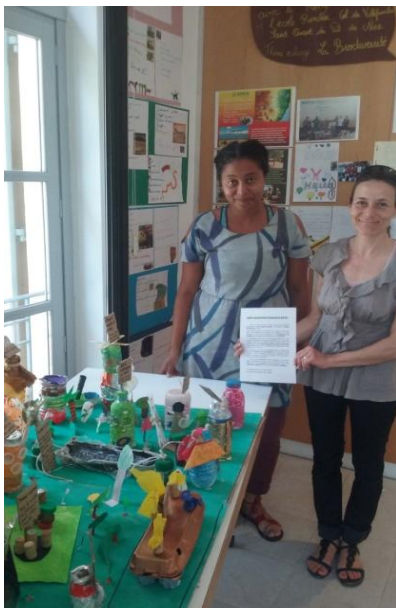
Exposition correspondance Maison de l'Environnement juin 2016

L'association « Sens Afrique solidaire » dont la dénomination a changé en mars 2016 pour devenir « Sens Solidaires » est une association d'intérêt générale ayant pour objet la réalisation d'actions de solidarité internationale dont l'objectif est de préserver l'environnement . Pour atteindre son but les moyens d'actions sont : - L'éducation à la conservation de la diversité biologique. - Le soutien à la gestion des ressources dans le cadre du développement durable. - la mise en œuvre d'actions de solidarité internationale et de projets générateurs de revenus pour les populations locales. - Le développement de liens interculturels entre le nord et le sud.