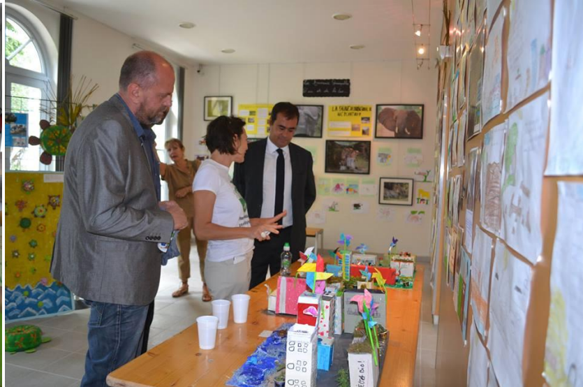
Inspecteur académique et Adjoint à l'éducation de la Ville de Nice

Impact du projet : sensibiliser les scolaires à la sauvegarde des écosystèmes ; les informer sur les modes de vie des populations cohabitant avec la nature. Puis se présenter à leur tour et exposer les problématiques environnementales liées à leur territoire. « Ouvrir l'éducation au développement durable à une dimension de solidarité internationale nous permet de proposer à l'élève de se situer à partir d'une triple démarche : être informé, être conscient, être capable de faire des choix ».