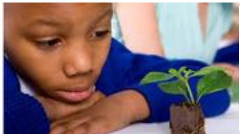
Scolaire abidjanais, Côte d'Ivoire

Issus de l'Agenda 2030 adopté par les Nations unies, les 17 Objectifs du développement durable portent les défis qui permettront d'améliorer la vie des populations partout dans le Monde. La Semaine européenne du développement durable est l'occasion pour tout un chacun en Europe de s'approprier ces objectifs.