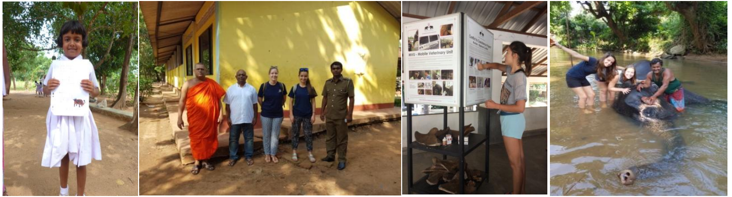
Gestion du musée et des soins quotidiens des éléphants domestiques maltraités : bain, repas, soins et nettoyage des litières.